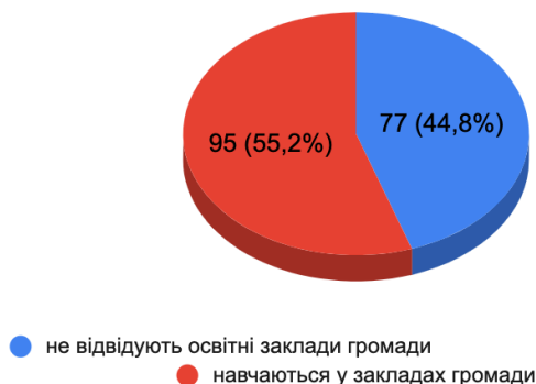
Рис. 2. Кількість ВПО шкільного віку (6-18 років), які користуються освітніми послугами у Громаді

Громада повною мірою забезпечена закладами освіти дошкільного та шкільного рівнів, а також позашкільної освіти. Заклади відкриті для навчання внутрішньо переміщених осіб. У 2023/2024 навчальному році заклади дошкільної освіти відвідують лише 19 дітей, а освітні заклади - 95 учнів. Таким чином, лише 55,2% дітей ВПО шкільного віку відвідують місцеві заклади освіти.